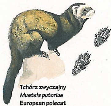
Tchórz zwyczajny Mustela putorius European polecat