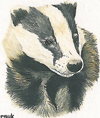
Borsuk Meles meles European badger