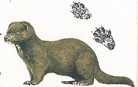
Norka amerykańska Neovison vison American mink