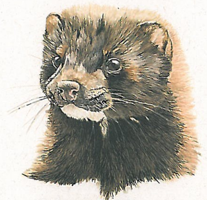
Norka amerykańska Neovison vison American mink