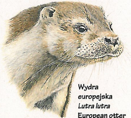
Wydra europejska Lutra lutra European otter