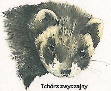
Tchórz zwyczajny Mustela putorius European polecat