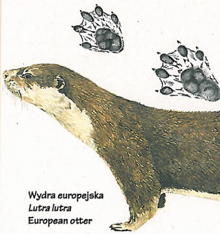
Wydra europejska Lutra lutra European otter