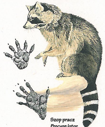
Szop pracz Procyon lotor Raccoon