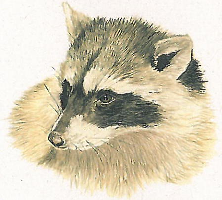
Szop pracz Procyon lotor Raccoon