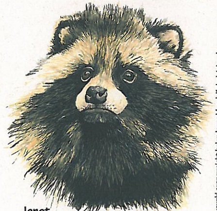
Jenot Nyctereutes procyonoides Raccoon dog

Ochrona ptaków wodnych i błotnych w pięciu parkach narodowych - odtwarzanie siedlisk i ograniczanie wpływu inwazyjnych gatunków* LIFE09 NAT/PL/000263 Protection of water and marsh birds in five national parks - reconstructing habitats and curbing the influence of invasive species* LIFE09 NAT/PL/000263