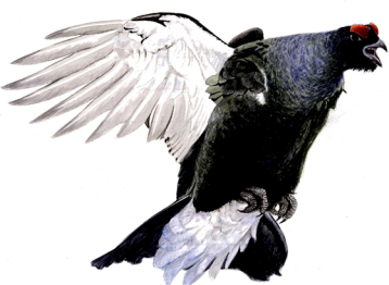
Rys. Marek Kołodziejczyk

Cykliczne spotkania informacyjne i wykłady tematyczne adresowane do miłośników Bagien Biebrzańskich oraz osób zaangażowanych w ich czynną ochronę i promocję. Zainaugurowana została w styczniu 2001 dzięki wspólnej inicjatywie WWF Polska, Biebrzańskiego Parku Narodowego, Stowarzyszenia Ekoturystycznego "Biebrza Koneserom", Towarzystwa Biebrzańskiego i Osowieckiego Towarzystwa Fortyfikacyjnego.